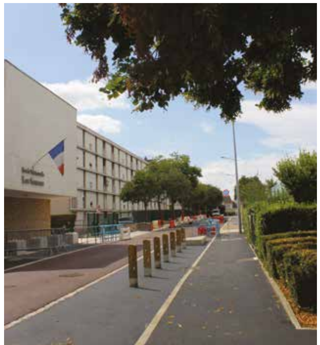
Perspective de la nouvelle petite voie des Fontaines.

Après les riverains de la résidence des closeaux, les collégiens et les jeunes enfants scolarisés à l'école des Sources vont découvrir à la rentrée, une petite voie des Fontaines toute neuve. Plusieurs mois de travaux ont été nécessaires afin de requalifier la voie, à la suite du passage du chauffage urbain.