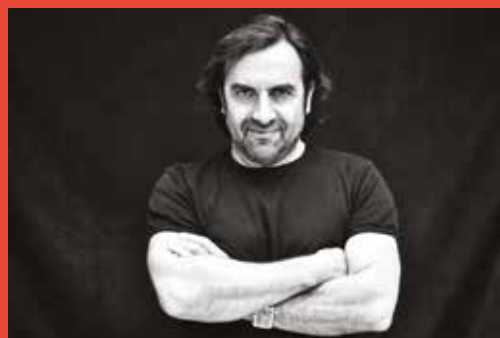
André Manoukian en concert le 30 septembre au Théâtre ; duel et duo avec Jean-François Zygel