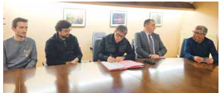
Signature de la mise à disposition du tracteur pour la plaine de Montjean, avec tous les partenaires.

Ce tracteur, propriété de la Ville, est donc mis à disposition de tous les exploitants de la plaine qui auront mission de se le prêter.