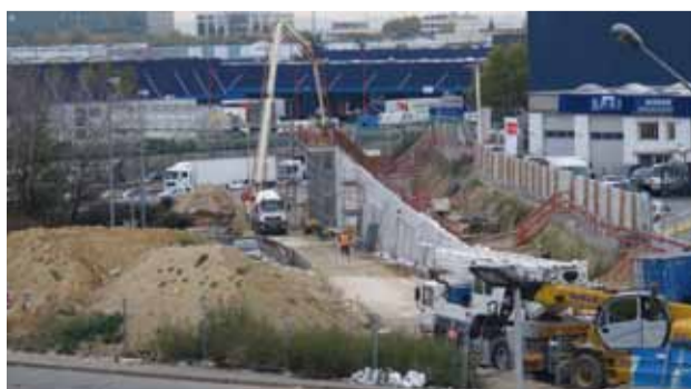
Mur de soutènement du pont de franchissement de l'A86