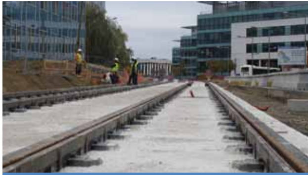
Les premiers rails posés au parc tertiaire Silic