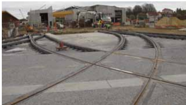
Des aiguillages multiples pour l'entrée / sortie du site