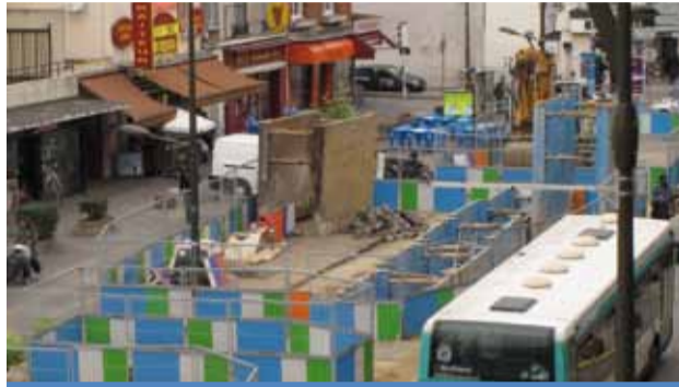
Pôle multimodal, avenue de Stalingrad à Villejuif