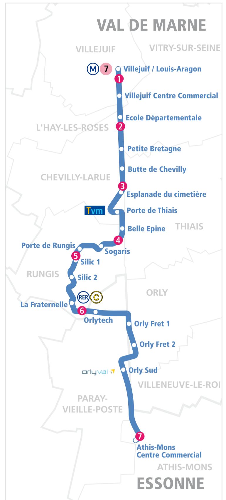
Repérage des chantiers de l'article « Les chantiers de l'hiver ». Les noms de stations sont provisoires.