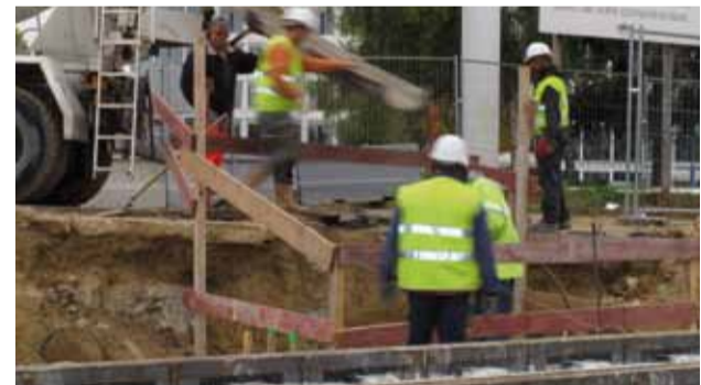
Carrefour Lindbergh à Rungis