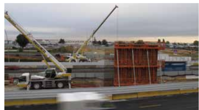
Ouvrage d'art au-dessus de l'A106 et de la RN7