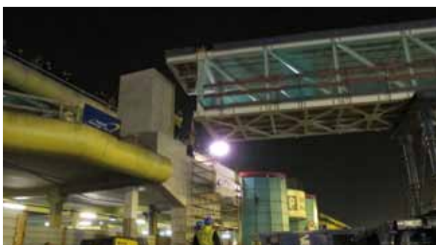
Levage de la passerelle piétonne Belle-Epine