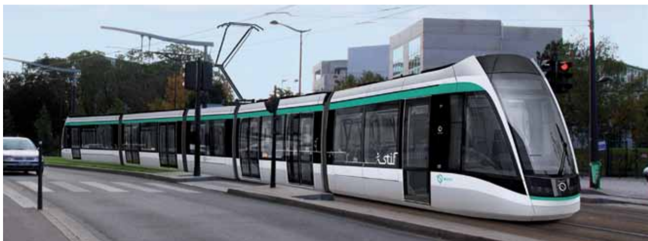
Design extérieur du tramway 7

Les rames de type Citadis 302, entièrement accessibles aux personnes à mobilité réduite grâce à leur plancher bas intégral, disposant d'écrans multimédia dédiés à l'information voyageurs, pourront accueillir 200 voyageurs, dont 54 assis.