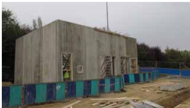
L'un des 7 postes de redressement pour le T7