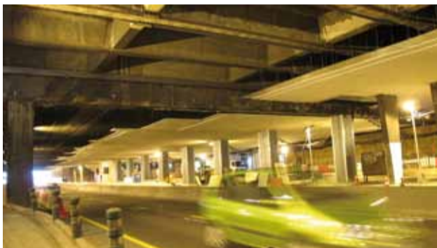
Le tunnel d'Orly en cours de sécurisation