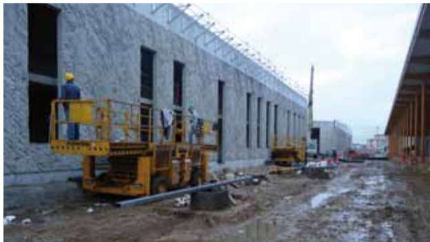
Des bâtiments pour l'entretien et le garage des tramways à Vitry-sur-Seine