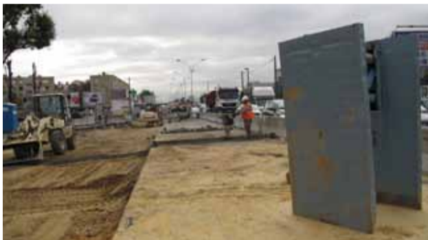
RD 7 à proximité du Parc départemental Chérioux